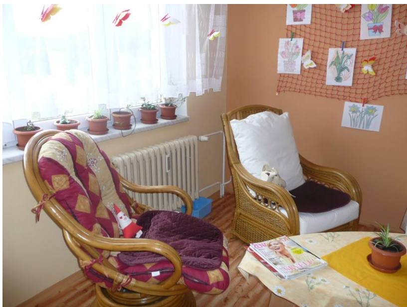
Odpočinková místnost pro klienty DZR