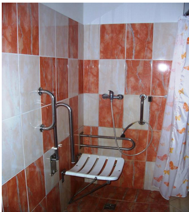
nově rekonstruované bezbariérové koupelny