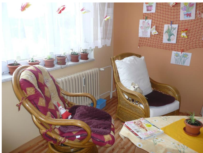
Odpočinková místnost pro klienty DZR