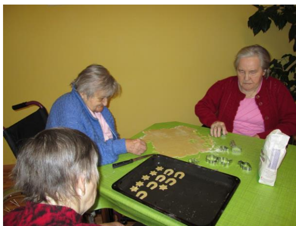
Aktivizace klientů DZR