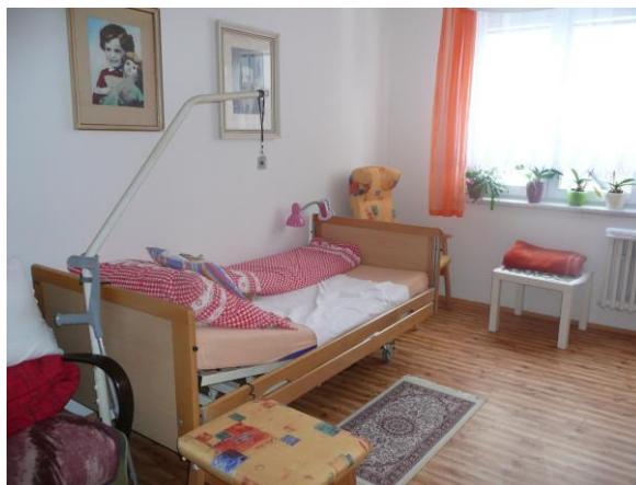
Pokoj klientů DPS