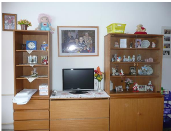
Pokoj klientů DZR