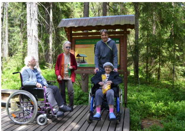
Výlet na Kladskou