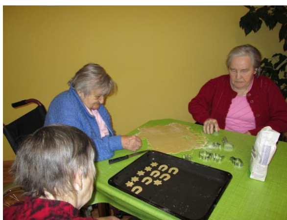
Aktivizace klientů DZR