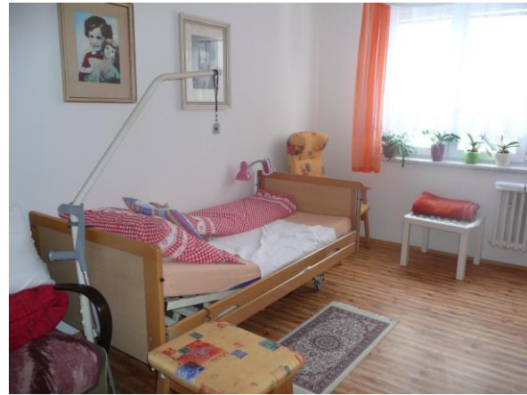
Pokoj klientů DPS