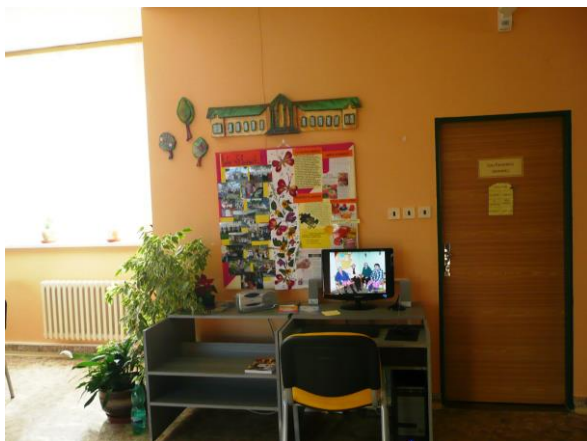
Koutek s počítačem pro klienty DPS