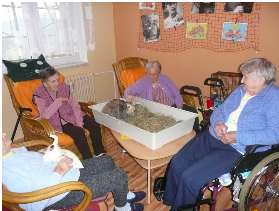
Odpočinková místnost pro klienty DZR