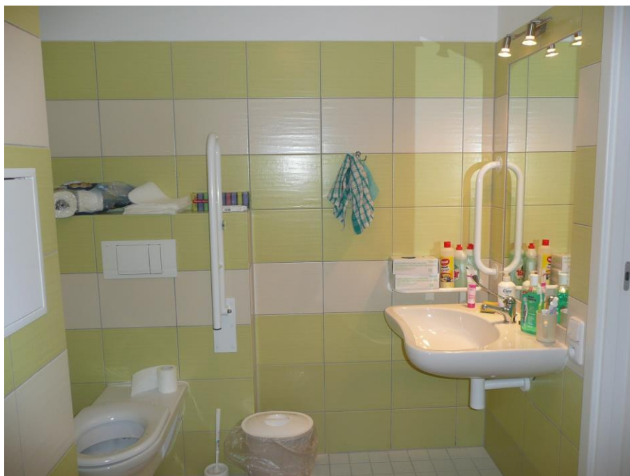
Bezbariérová koupelna DZR