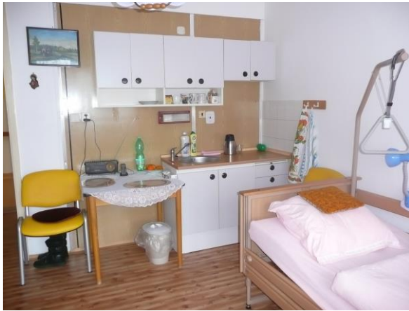
Pokoj klientů DZR