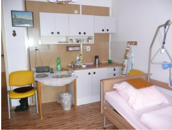
Pokoj klientů DZR