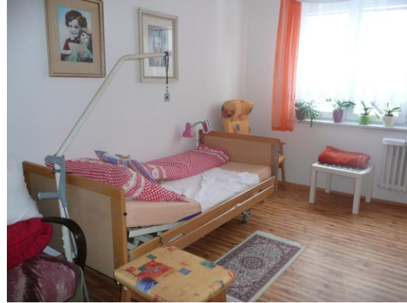
Pokoj klientů DPS