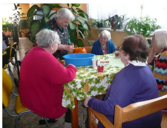
aktivizace klientů na hale DPS