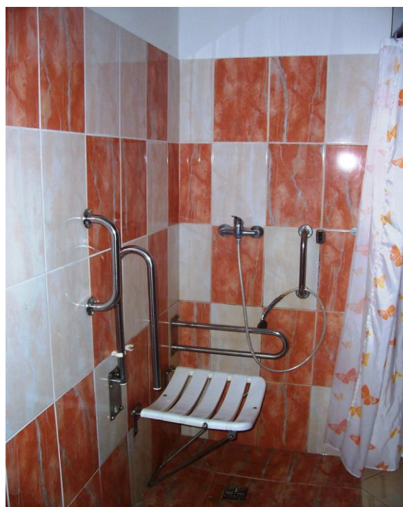
bezbariérová koupelna DPS