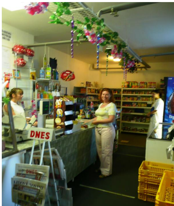
obchod se smíšeným zbožím v našem zařízení