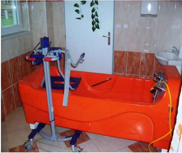
bezbariérová kúpeľňa 1