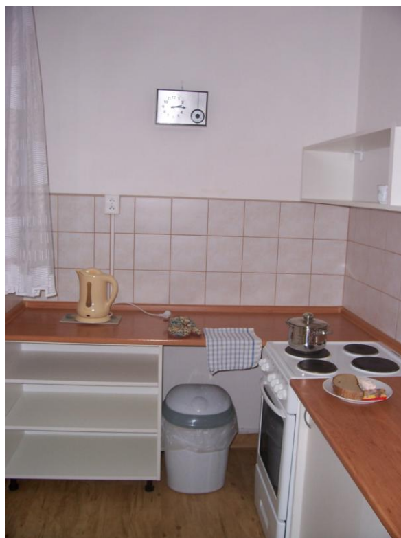
kuchyňka pro klienty