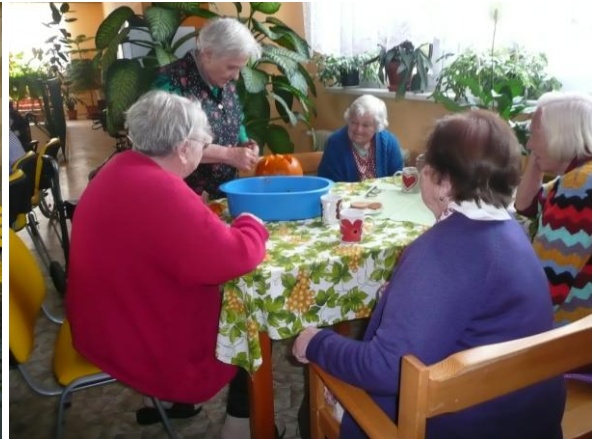
aktivizace klientů na hale