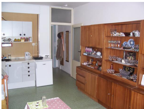
Pokoj klientů 1

Služba ubytování zahrnuje veškeré provozní a režijní náklady spojené s ubytováním , tj. dodávka tepla, teplé vody, studené vody, osvětlení společných prostor, provoz výtahů, společná TV anténa, odvoz odpadu, praní prádla, žehlení, mandlování, drobné opravy .