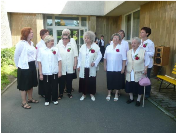
pěvecký kroužek Správný holky