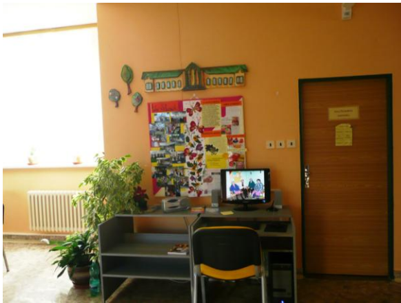
Koutek s počítačem pro klienty